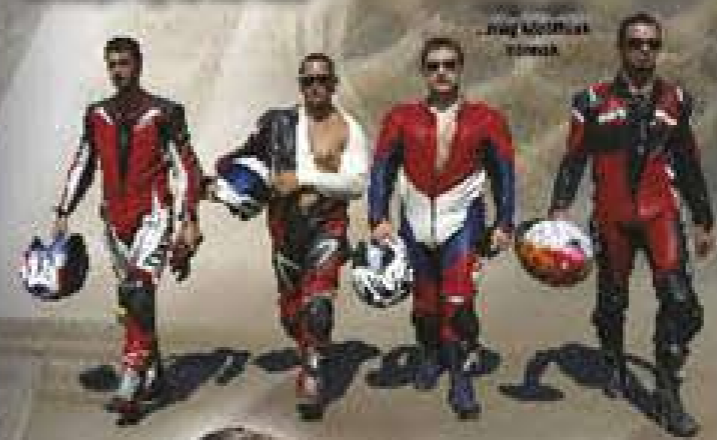
„Magyar MotoGP versenyzők”

A századik jubileumi kiadás alkalmából a SuperBike magazin megajándékozta Olvasóit a valaha volt legőszintébb és legszókimondóbb cikkével – saját magáról. Íme az elmúlt több mint nyolc év sztorija, amely valóban bepillantást enged a kulisszák mögé.